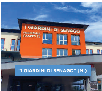
"I GIARDINI DI SENAGO" (MI)