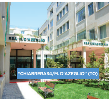
"CHIABRERA 34/M. D'AZEGLIO" (TO)