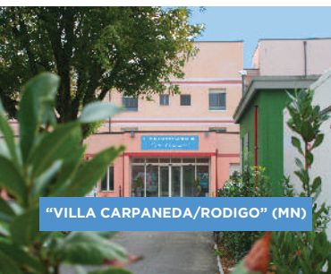
"VILLA CARPANEDA/RODIGO" (MN)