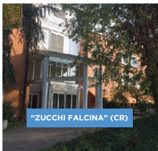
"ZUCCHI FALCINA" (CR)