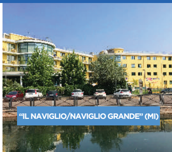
"IL NAVIGLIO/NAVIGLIO GRANDE" (MI)