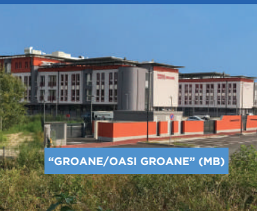
"GROANE/OASI GROANE" (MB)