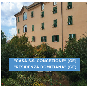
"CASA S.S. CONCEZIONE" (GE) "RESIDENZA DOMIZIANA" (GE)