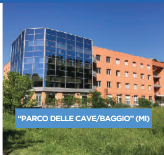
"PARCO DELLE CAVE/BAGGIO" (MI)